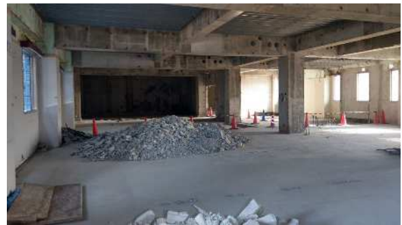
写真④ 管理棟既存設備解体状況