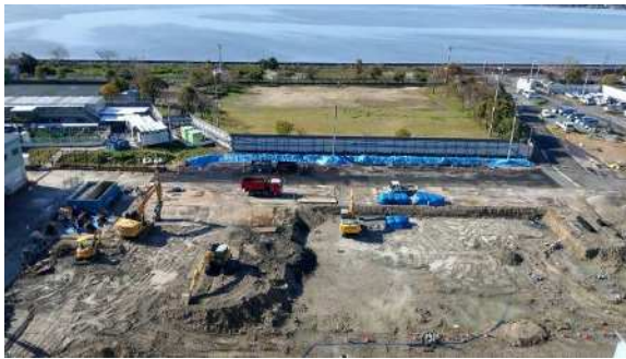
写真① 前処理棟建設状況