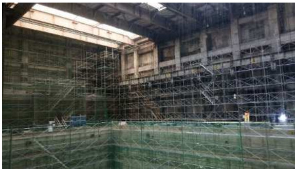
写真③ ごみピット補修状況