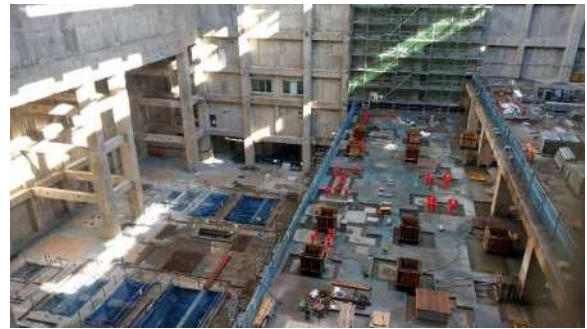
写真② 工場棟炉室施工状況