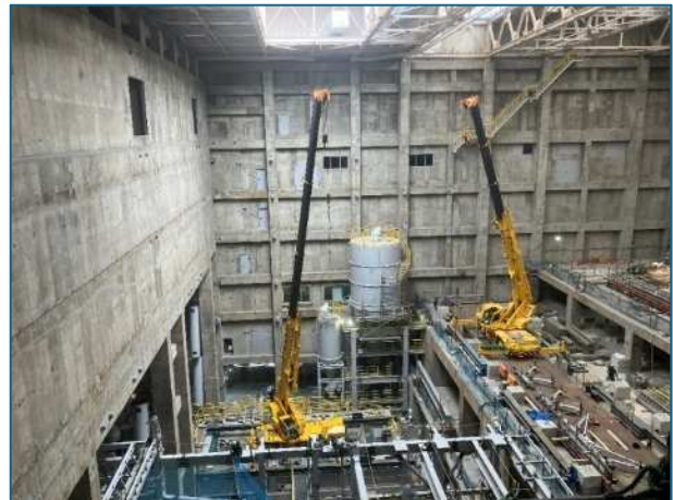
工事状況（焼却施設内部）