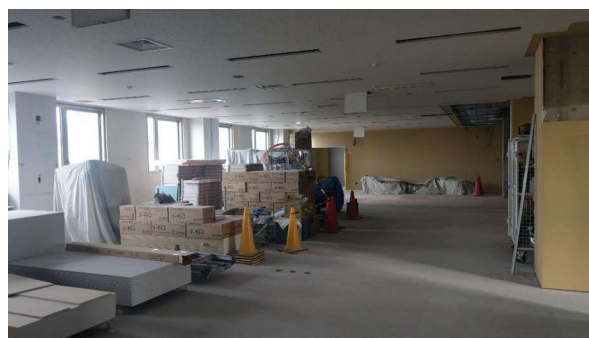
写真④ 管理棟会議室改修状況