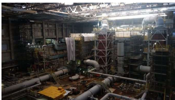
写真③ 工場棟炉室施工状況