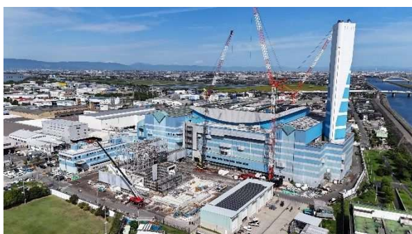
写真① 南陽工場全景