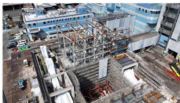
写真② 前処理棟建設状況