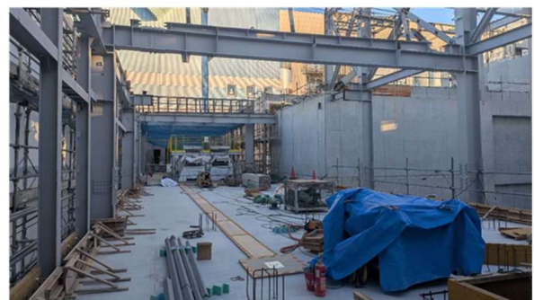
写真④ コンベア棟建設状況