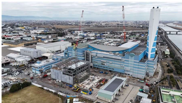
写真① 南陽工場全景